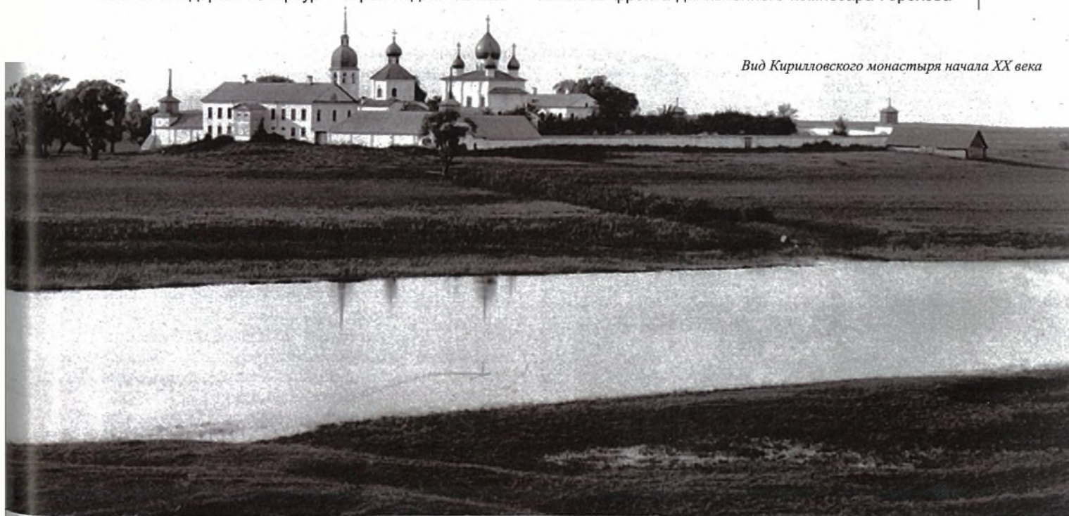
Вид Кирилловского монастыря начала XX века