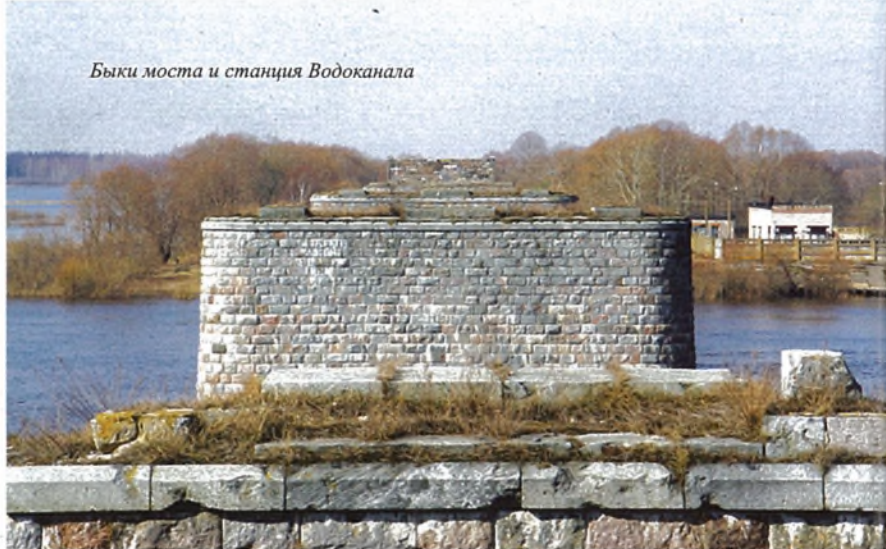
Быки моста и станция Водоканала

В районе Новгорода, где оборона врага совершенствовалась уже в течение четырех месяцев, форсирование было обречено на неудачу. В связи с этим, на Новгородском направлении советская сторона активных наступательных