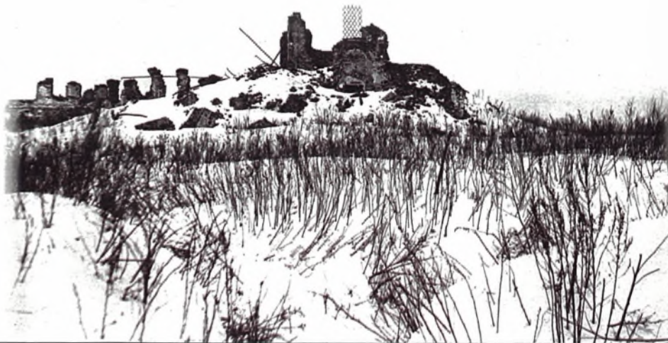
Развалины Кирилловского монастыря 1944 год

27 января в журнале боевых действий 225-й стрелковой дивизии появится запись: «...Вели на-