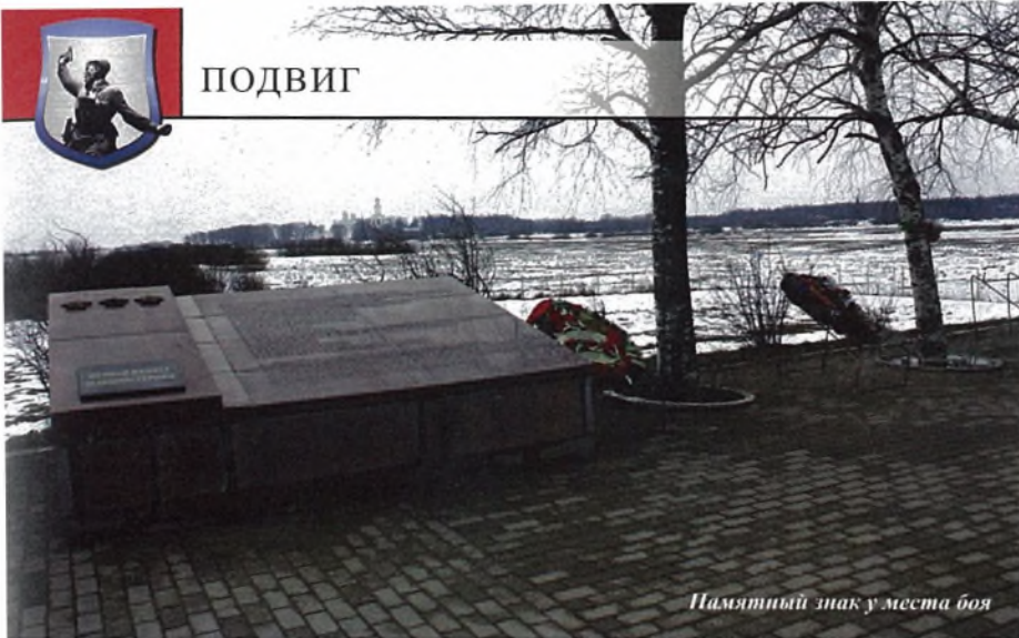
Памятный знак у места боя

попытки противника переправиться через Волхов, особенно в районе Свято-Юрьева монастыря в направлении д. Городище.