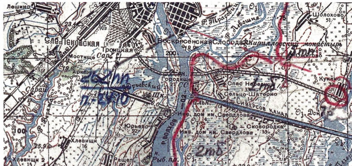
Карта с обозначением линии фронта