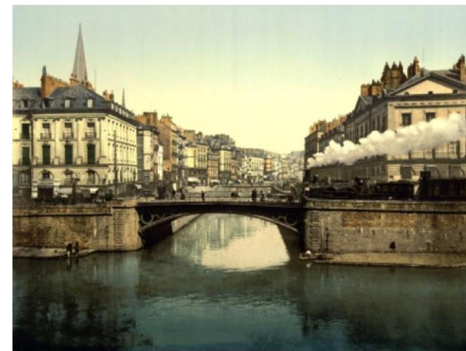
Франция, г. Нант. Фото нач. XX в.

• Развитие геоботаники: история и современность: материалы Всероссийской конференции, посвященной 80-летию кафедры геоботаники и экологии растений Санкт-Петербургского (Ленинградского) университета и юбилейным