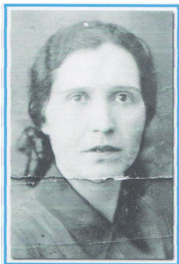
Мама, зима 1940 г., фото на доску почета в госпитале для раненых Финской войны.

Помню, во дворе было корыто деревянное, мы в нем качались. В корыте торчал ржавый гвоздь, и я наколола гвоздем ногу. Ночью у меня поднялась высокая температура, когда меня привезли в больницу, врачи сказали, что началось заражение крови и хотели отнять ногу. Мама просила, чтобы лечили, не отнимали ногу. Вот, после этого случая она не осталась в той деревне, и решила перебираться в более цивилизованное место.