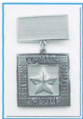
Знак «Ветеран завода «Волна», 1973 г.

благодарностей и почетных грамот, денежные премии, путевки, много путешествовала, побывала во многих городах Советского Союза. В 1972 г. за хорошую работу меня премировали 2-х недельной поездкой в Австрию. Мы жили в домике, где ранее на олимпиаде в Инсбурге жили наши хоккеисты.