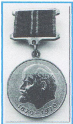
Юбилейная медаль «100 лет В.И.Ленину».