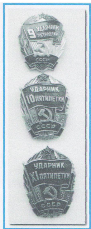
Знаки отличия «Ударник пятилетки», 9, 10, 11 пятилетки.